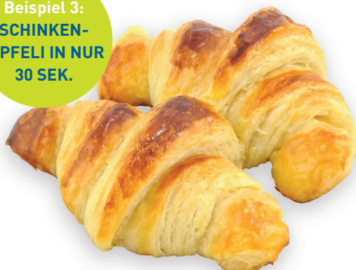
Beispiel 3: SCHINKEN- GIPFELI IN NUR 30 SEK.