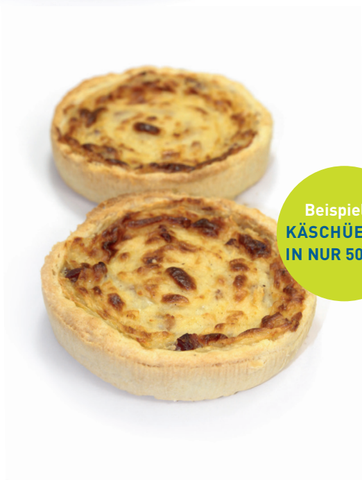
Beispiel 2: KÄSCHRÜECHLI IN NUR 50 SEK.