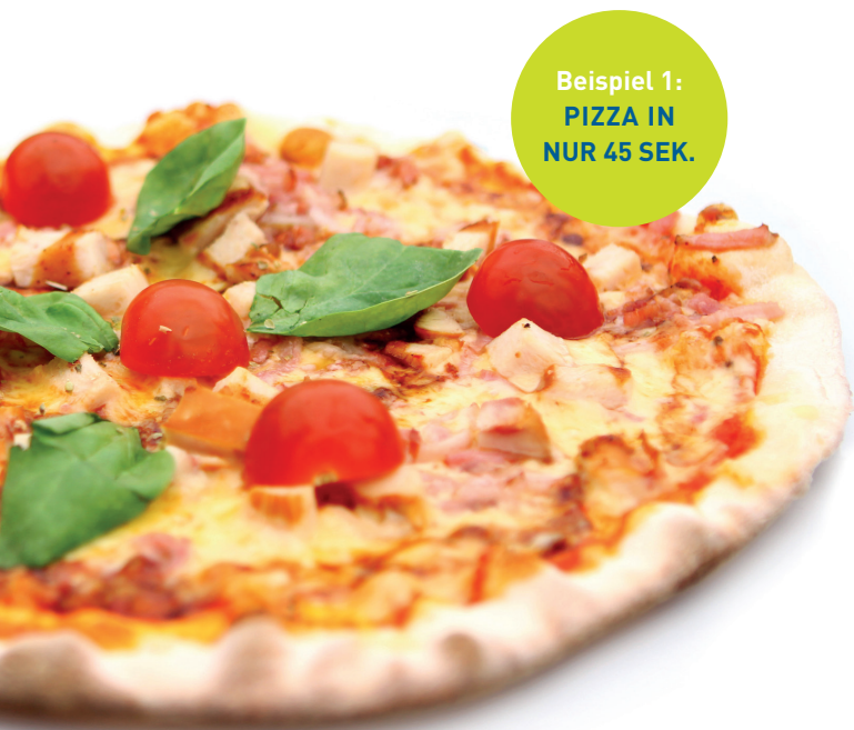
Beispiel 1: PIZZA IN NUR 45 SEK.